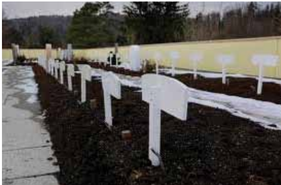
مقبرة زيورخ فيتيكون، مدينة زيورخ

يجب تعريف كل قبر بعلامة (شاهدة)، سواء المحتوى أو الحجم يحتاج إلى موافقة مسؤول المقبرة عليها. من الممكن أن تكون لوحة كتابية بسيطة، تحتوي على الأقل على الإسم وسنة الولادة والوفاة وبالأحرف اللاتينية.